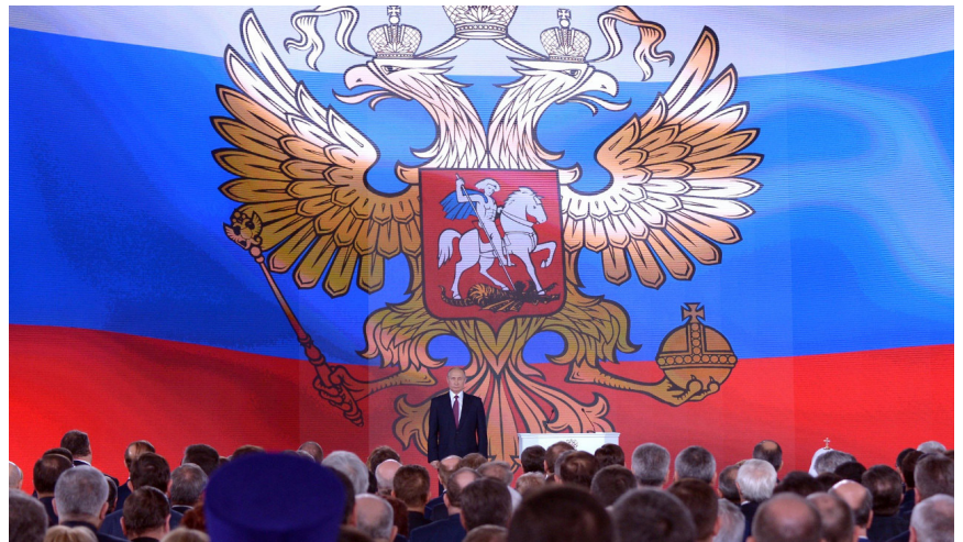
El Presidente de Rusia, Vladimir Putin, en su informe a la nación ante la Asamblea Federal de Rusia, el 1 de marzo de 2018, Moscú.

La respuesta de los medios noticiosos y de los políticos occidentales ha sido muy diversa, desde tratar de ridiculizar las aseveraciones de Putin como algo imposible técnicamente, tachándolas de mera bravata electoral, hasta la manifestación de preocupación ante