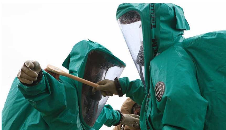
Foto de archivo: Infantes de marina de EU practican procedimientos de descontaminación. Abril de 2013 (Departamento de Defensa de Estados Unidos).

Pero el mundo ha cambiado. En vez de seguir diligentemente la “relación especial” con la madre patria, el Presidente Donald Trump llamó por teléfono el 20 de marzo de 2018 al Presidente Vladimir Putin. Los mandatarios de Estados Unidos y de Rusia sostuvieron una plática amplia y decorosa sobre la necesidad de que estas dos grandes naciones, junto con China bajo el liderazgo capaz de Xi Jinping, pueden y deben empezar a trabajar en resolver las múltiples crisis existenciales que enfrenta la humanidad. Una discusión entre adultos sobre el mundo real, para aportar un verdadero liderazgo a un mundo que los lores de Londres y sus sátrapas de Europa y Estados Unidos quieren llevar al borde un holocausto termonuclear y caos económico global.